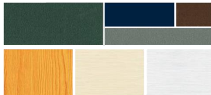
GAMA DE COLORES ILIMITADA